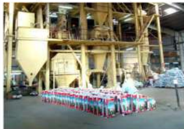
Đầy thuyền sản xuất ở nhà máy chế biến thực ăn chăn nuôi của Công ty TNHH Aurofeed Bình Định.

Những năm gần đây, nhờ lợi thế về vị trí địa lý, vị trí địa vị, giao thông, nguồn nguyên liệu và đầu tư sản phẩm, ngành chế biến thực ăn chăn nuôi (CBTN) tỉnh Bình Định có bước phát triển khá mạnh.